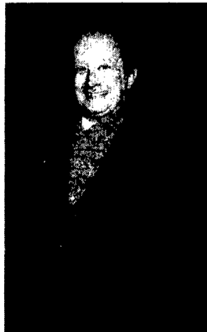
Orgeira se fue sonriendo