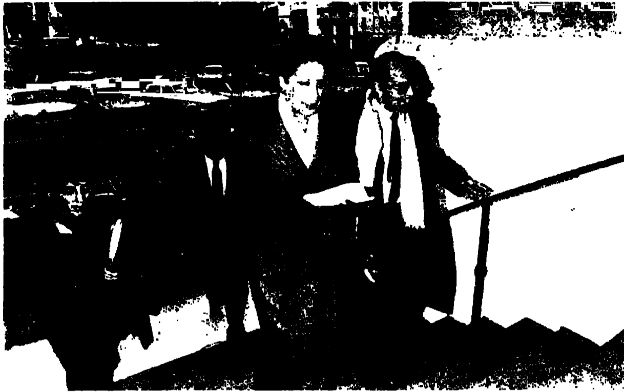
Patricia Derian ingresa al Palacio de Tribunales. Minutos más tarde, por ahí se fueron los defensores.

—Entrevisté al almirante Massera el 10 de agosto de 1977, a las once de la mañana. Me recibió en la