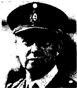
General Suárez Mason