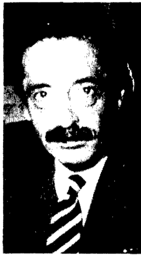
Fiscal Strassera: "Hay que respetar el dolor humano"

—Esto quería yo hacerle decir a alguien por- que esto es una cosa fuera de toda lógica ¿cómo grupos sueltos? Vea señor, cuando pasa en todo el país, dada la estructura piramidal de las fuerzas militares los únicos responsables son los comandantes.